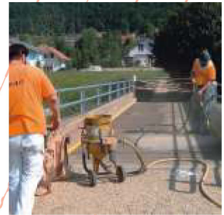
Vorbereiten des Objektes im Sandstrahlverfahren.

Die Schweizerische Vereinigung für Qualitäts- und Management-Systeme hat allen RSAG-Unternehmen bescheinigt, dass sie über zuverlässige Management-Systeme verfügen, welche den Anforderungen der internationalen Norm für Qualitäts-Management und Qualitätssicherung (ISO 9001) entsprechen.