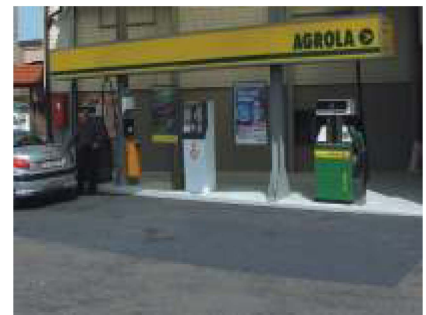
Öl- und benzinresistente Beschichtung bei Tankstelle.