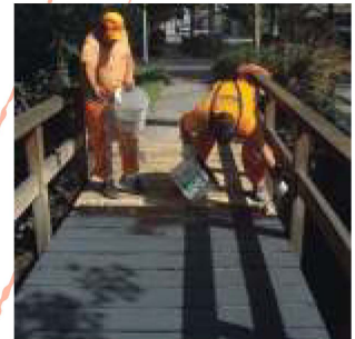
Auftragen des Beschichtungsmaterials auf dem sauberen Untergrund.